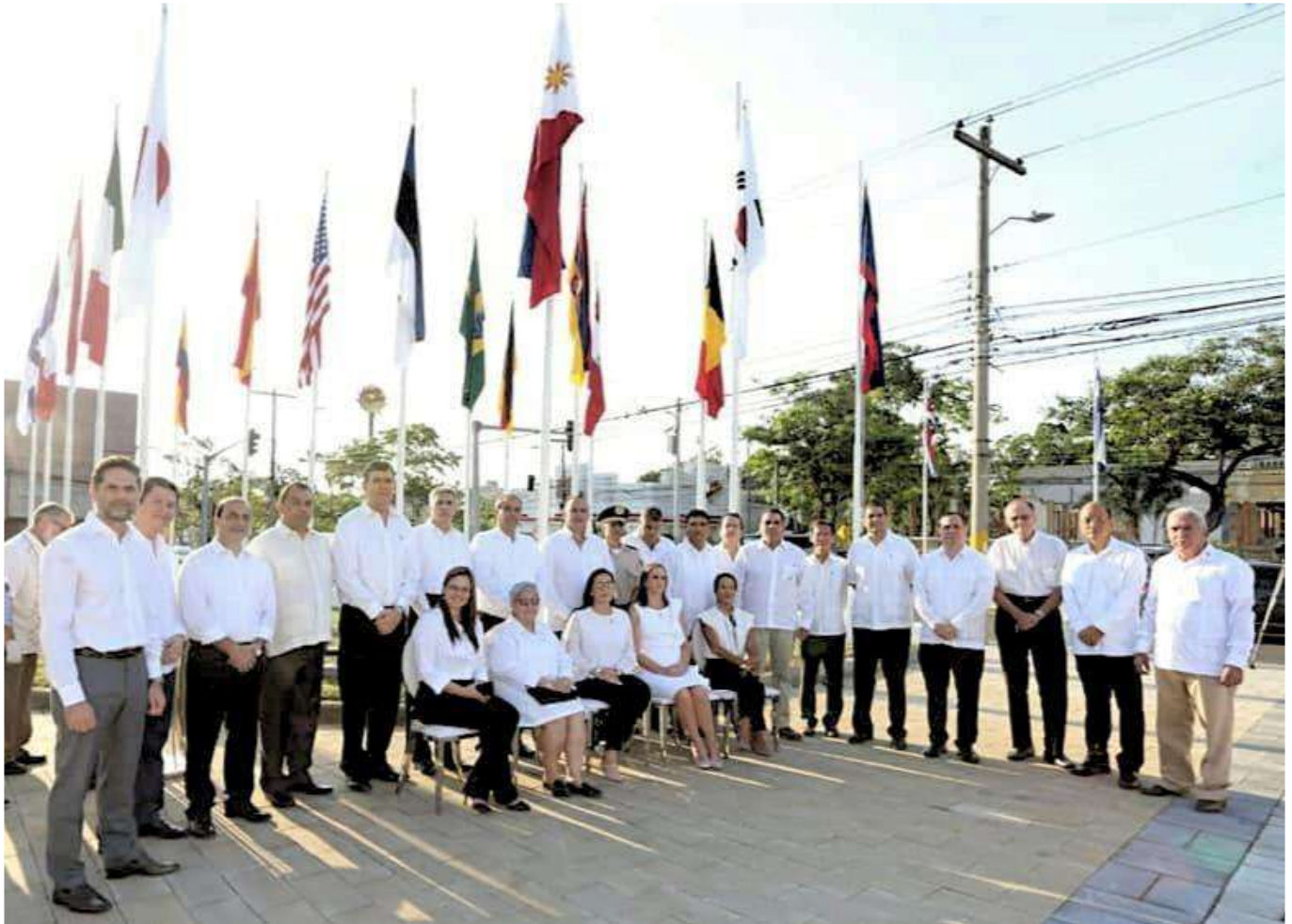
Miembros de la Asociación Cuerpo Consular Sampedrano y la Corporación Municipal de San Pedro Sula en la Ceremonia de Inauguración de la Plaza de Banderas.