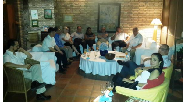
Al fondo: Miembros del Cuerpo Consular Sampedrano departiendo en la reunión mensual.

A la nueva junta directiva se les felicita y se les desea un periodo más lleno de muchos éxitos. Su juramentación será realizada en la primera reunión mensual del año 2015.