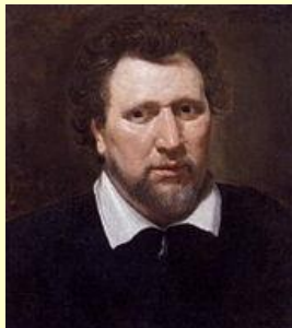
Ben Jonson (1572 - 1637)

Los grandes trabajos no son hechos por la fuerza, sino por la perseverancia.