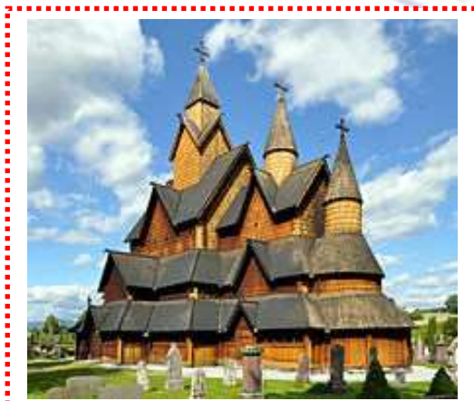
Iglesia de madera de Heddal en Notodden, la mayor Stavkirke de Noruega