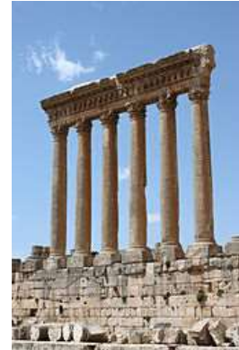
Templo de Júpiter en Baalbek, localidad ubicada a 86 kilómetros al este de Beirut.