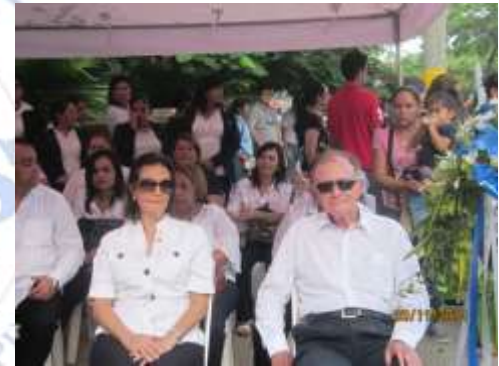
En los actos en la Plaza Valle: