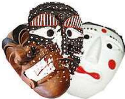
El tal (탈), máscara folklórica coreana, representante simbólico del han (한).