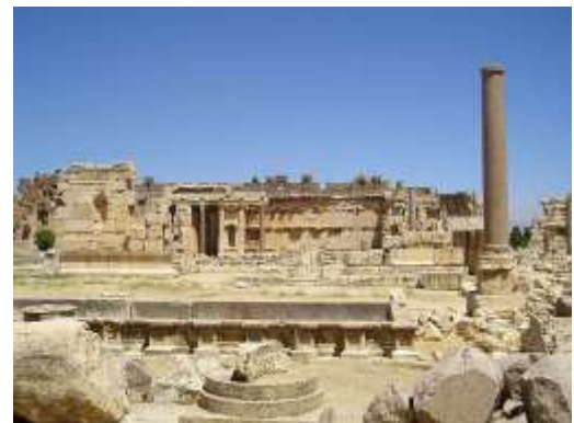
El Gran Patio del Templo de Júpiter