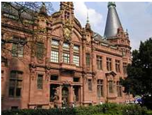
La Universidad de Heidelberg, fundada en 1386, es la más antigua de Alemania y una de las más reputadas del país