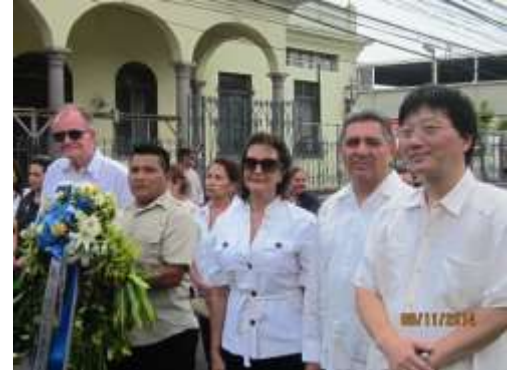
Durante la marcha hacia la Plaza Valle:

La marcha finalizo en la Plaza Valle, lugar al que la comitiva del Cuerpo Consular se presentó para colocar un hermoso arreglo floral al pie de la estatua del General Francisco Morazán.