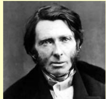
John Ruskin (1819 - 1900)

La sinceridad es la raíz de todas las virtudes.