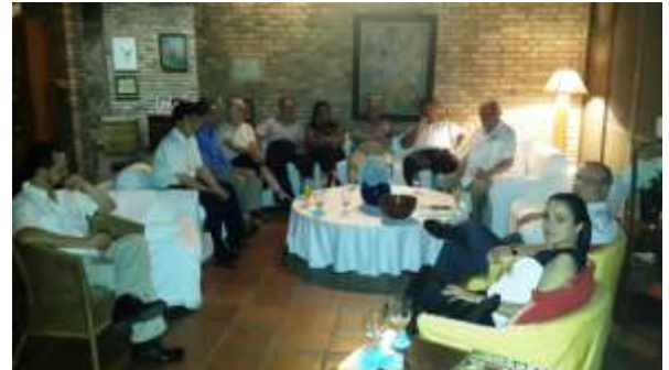
Al fondo: Miembros del Cuerpo Consular Sampedrano departiendo en la reunión mensual.