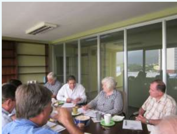
Directivos del Cuerpo Consular Sampedrano durante la sesión mensual de trabajo, en la sala de reuniones de la sede del Consulado de Alemania.

La ACCS agradece a la Cónsul de la República de El Salvador, por sus amables atenciones como anfitriona de la reunión.