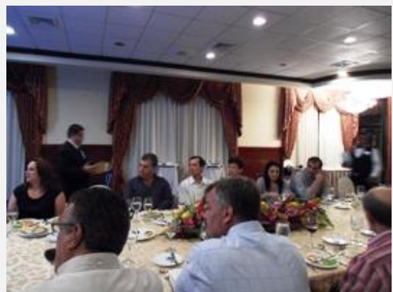
Miembros de la ACCS escuchan atentos la disertación ofrecida por UNITEC