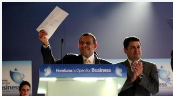
El Presidente de Honduras, Porfirio Lobo, y el Presidente del Congreso Nacional, Juan Orlando Hernández, durante la Inauguración del evento.

Durante este evento, los diferentes miembros de la Asociación Cuerpo Consular Sampedrano desempeñaron un papel importante como enlaces locales entre importantes inversionistas extranjeros y nacionales.