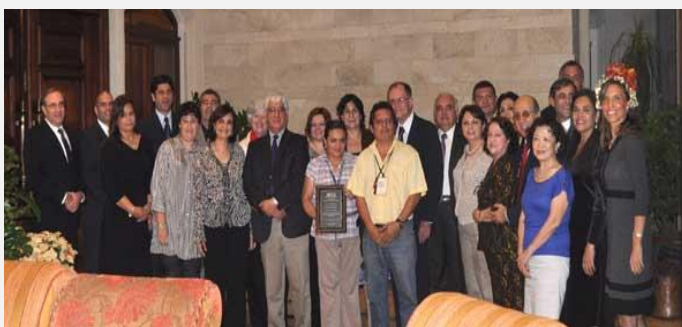
Miembro de la ACCS en el reconocimiento a los medios de comunicación