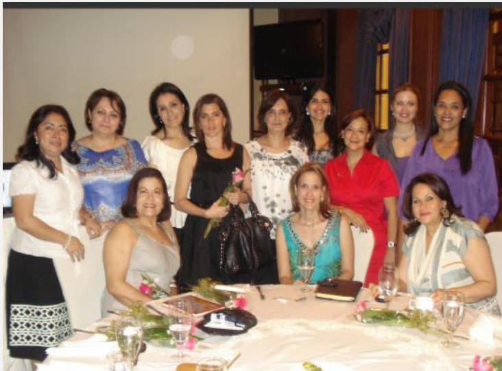
Al centro la esposa del alcalde de San Pedro Sula en compañía de las Damas de la ACCS, asistentes al evento

En una amena tarde, el pasado 24 de enero del 2011, se agasajó a las damas del Cuerpo Consular Sampedrano, con motivo de la celebración del Día de la Mujer.