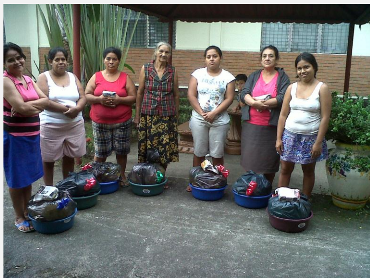
Familias de la localidad de Nueva Esperanza, recibiendo sus canastas de víveres.