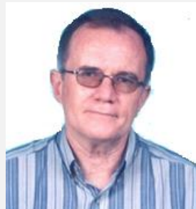
Gregory Werner Presidente Electo

“Nuestra filosofía de trabajo estará enfocada en el fortalecimiento de la misión y visión, que son el eje fundamental y razón de ser